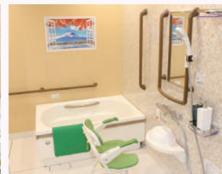
※居室内の写真は建物建設中のため、写真は同系列他施設のもです。