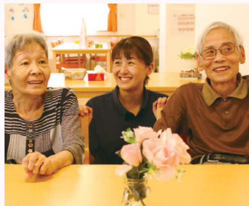
ハピネス ナーシングホーム はまなすの里 〒921-8816 石川県野々市市若松町1番51号