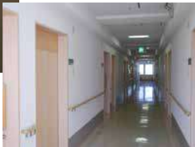
明るくて広い廊下