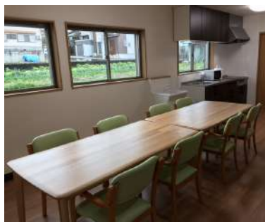
食堂・リビングイメージ